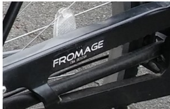
Un gros plan sur la marque du vélo