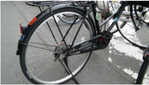
Mon favori : un vélo, à Ise