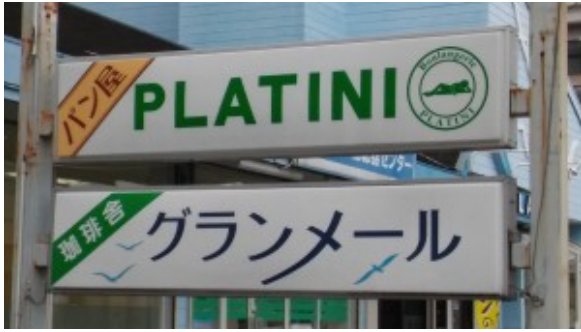
Une boulangerie, à Ise